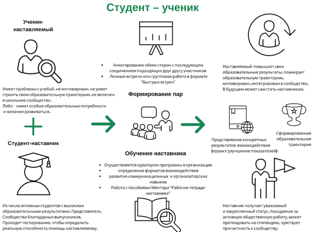
Рисунок 3. Графическое представление наставнического взаимодействия по форме «студент – ученик»