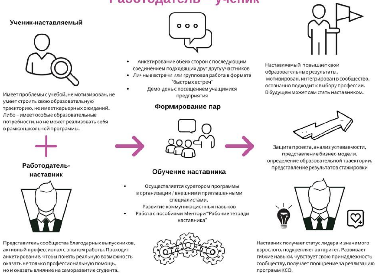
Рисунок 4. Графическое представление наставнического взаимодействия по форме «работодатель – ученик»