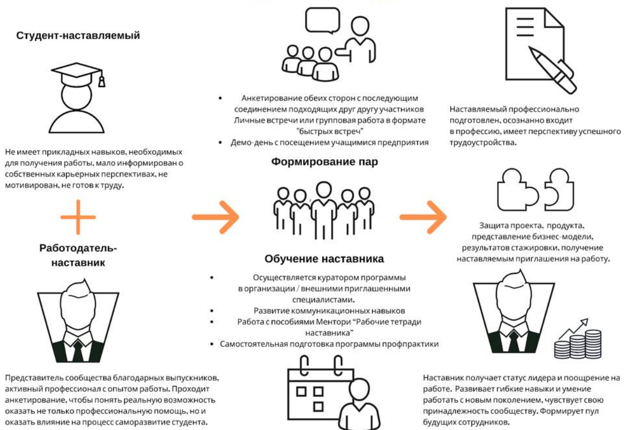
Рисунок 5. Графическое представление наставнического взаимодействия по форме «работодатель – студент»