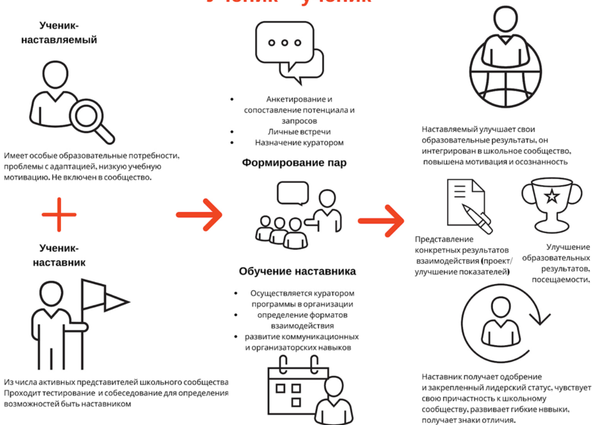
Рисунок 1. Графическое представление взаимодействия по форме «ученик – ученик»